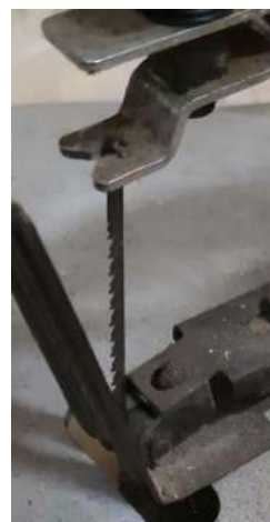
Rechts: ophangstelsel met dwars-stiftje